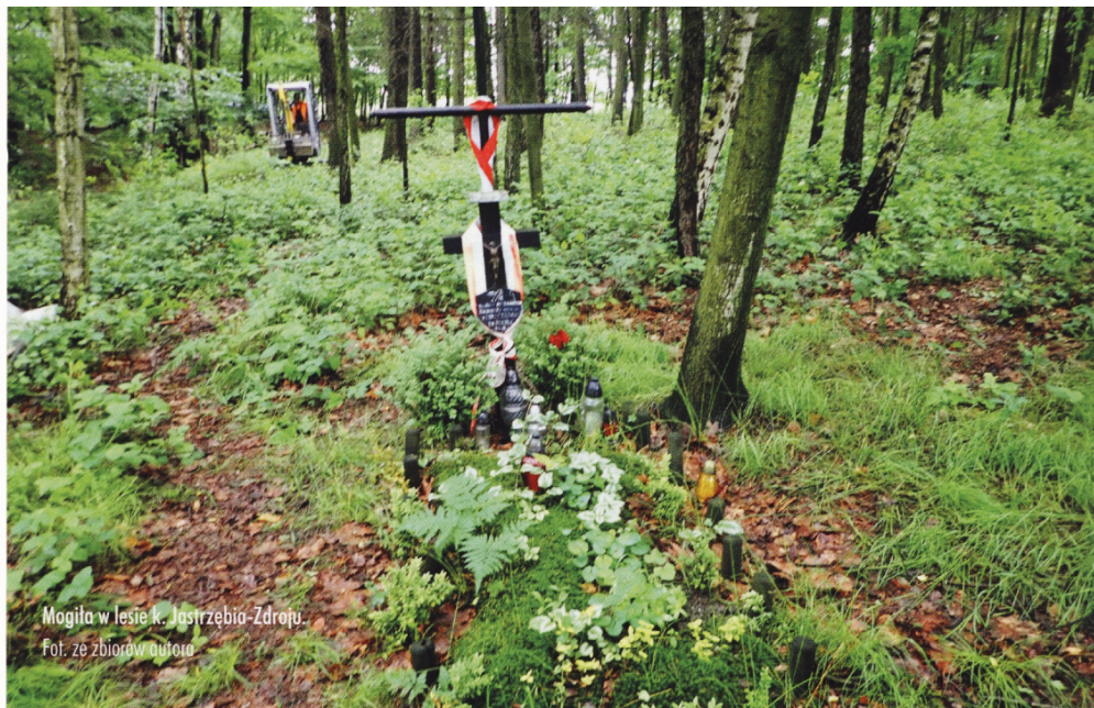
Mogila w lesie k. Jastrzębio-Zdroju.